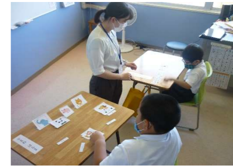
たんぼぼ カードを使つての学習。