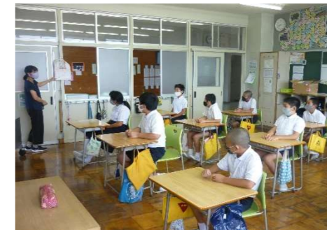
6年生 カレンダーを見ながら今後の確認。