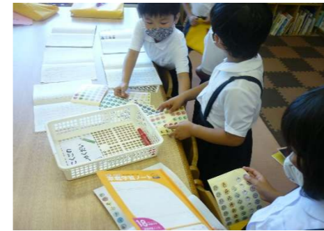
1年生 夏休みに読んだ本のページ数確認。

8月18日(水)は6年生、20日(金)は1年生、2年生、3・4年生、5年生、たんぼぼ学級の学年登校日でした。日焼けした児童が多かったです。夏休みの思い出を伝え合ったり、宿題を提出したりしていました。