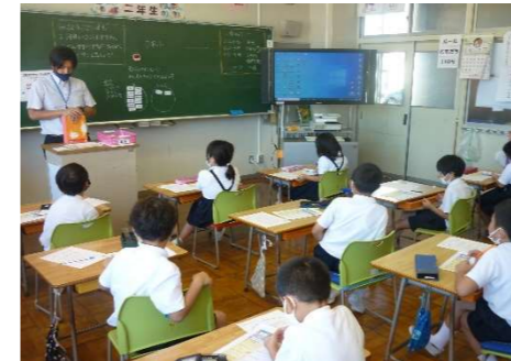
2年生 読書感想文の書き方についての学習。