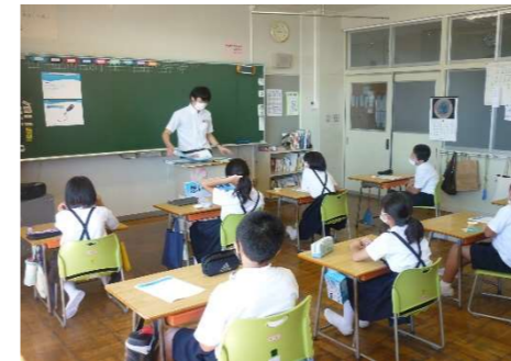
5年生 パラリンピックについての学習。