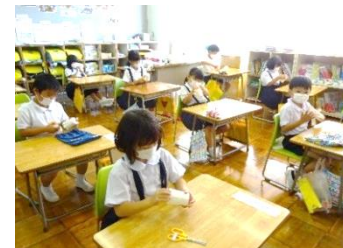
紙コップ工作（1年生）

2日は、校外子ども会でラジオ体操の役割分担や並び方、地区の危険個所の確認を行いました。また、学級で平和について本の読み聞かせを聞いたり、平和について考えたりしました。22日は、各学年で工作をしたり、畑の作物や花壇の花の観察や収穫を行ったり、図書の本を借りたりしました。