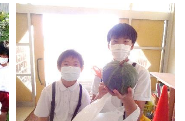
かぼちゃの収穫（4・5年生）