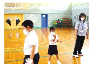
自作ブーメランを飛ばす様子（たんぼぼ）