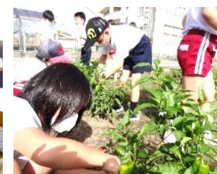
畑の作物を観察と収穫（2年生）