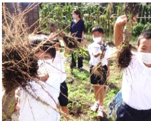
ブロッコリーの根の観察（3年生）