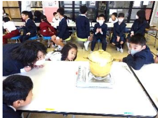
鍋に半分入れた水が沸騰したら、ポリ袋を入れて茹でます。茹で時間は、20分間です。