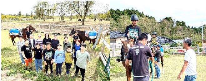
6年生は、蛸島にある「珠洲ホースパーク」に行き、親子で馬に餌をやったり、馬に乗ったりしました。