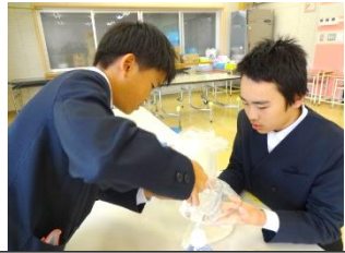
5・6年生が下ごしらえをしました。ポリ袋に無洗米1合と飲料水約210mlを入れ、30分吸水をしておきました。

21日(木)には、「あったかポリ袋でご飯づくり」を行いました。5・6年生が米作り体験をしたことから、お世話をさせていただいた方々への感謝、収穫することへの喜びを振り返りました。さらに、今年度は新たに防災の視点を取り入れ、停電や断水時でもできることはないかと考え、「いつでもどこでも手に入るものを使ってのご飯づくり」に挑戦しました。