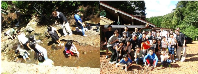
4年生は、ケロン村に出掛けました。親子で、植樹・川遊び・遊具での遊び・ピザづくり・ピザの試食をしました。