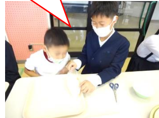
20分茹でたら、やけどをしないようにポリ袋を取り出します。結び目を切り取り、お茶碗に盛ります。