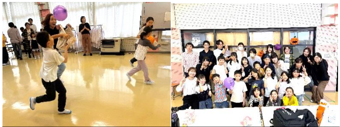
3年生は、親子でいろんな形の折り紙を折ったり、ボールを使ったゲームをしたり、パンケーキ作りをしました。