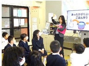
全校児童が、ポリ袋を用いたお米の炊き方について聞いているところです。