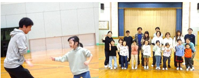
1年生は、親子でしっぽとり・ドッジボール・じゃんけんりレー・ボウリング・宝探しをしました。