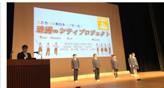
6年生の発表の様子