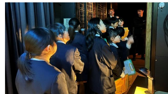
ステージ袖で待機する 3年生

11月30日（土）、珠洲市里山生き物観察会活動報告会【3年生発表】とSDGs学習取組報告会【5・6年生発表】が、ラポルトすずで行われました。3年生は、直播きの田んぼ、田植えの田んぼの生き物を比較し、「なぜゲンゴロウが多く生息しているのか」「2種類の田んぼがあることで生き物にどんな影響があるのか」等自分達が疑問に思い、調べたことを堂々と発表出来ました。5年生は、ゴール14「海の豊かさを守ろう」がテーマでした。地震や豪雨の影響で、現在海の豊かさにどんな危機が迫っているか、その豊かな海を守るためにポスター作り等自分達に何が出来るかを、わかりやすく発表出来ました。6年生はゴール11「住み続けられるまちづくりを」をテーマとし、自分達が「キャプテン」となって「ごみ拾い活動」「珠洲の魅力発信」等、アイデア豊かに取り組んできたことをエネルギーに伝えてくれました。沢山の人の前で発表することは、緊張しますが、そこでしか学べないことが数多くあり、確かな成長をしてくれたことでしょう。