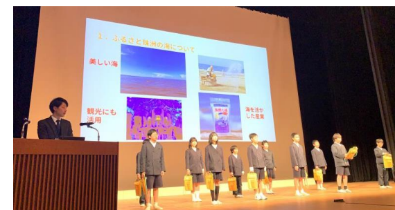
5年生の発表の様子