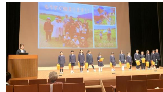
3年生の発表の様子