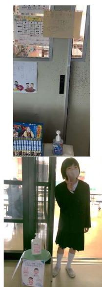
2年生の良い姿勢動画、クラスルームに掲載！