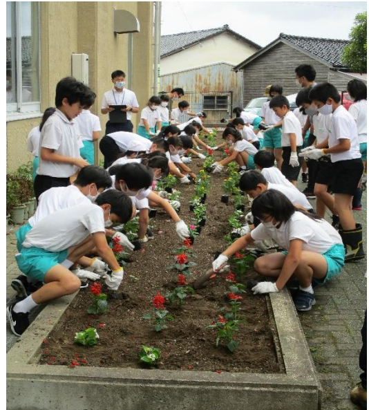
プログラム委員の呼びかけで、たくさん子どもボランティアが集まりました