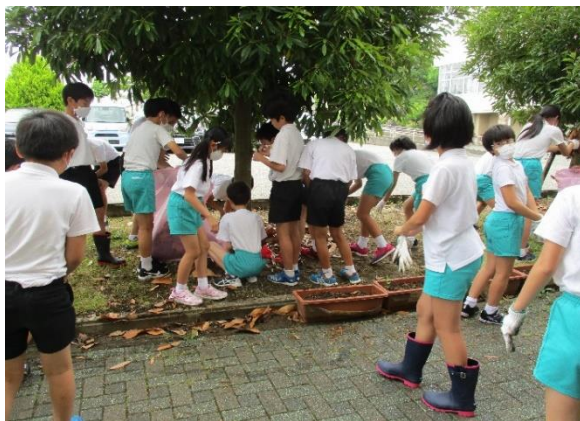
たくさんあった落ち葉を集めました