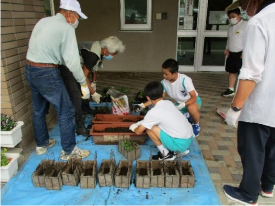
ハンギングポットとプランターにも植えました

7月1日に、保健室前のコミュニティ花壇に夏の花の苗を植えました。プログラム委員と4～6年生のボランティアの子ども達約60名が参加しました。園芸に詳しい地域のボランティア「フラワーアドバイザー」の9人の方々に、植え方を教わりました。子ども達はあっという間に花の苗を植え、落ち葉の掃除もしてくれ、玄関前はすっきりきれいになりました。