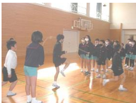
8の字とび（なわとび）大会

2月には6年生を送る会があり、児童にとっては、1年をふり返り6年生への感謝の気持ちを持って活動に取り組みます。改めて様々な人にお世話になってきたことを自覚することが人としての成長につながる大切な機会になると考えています。寒さはこれからが本番ですが、児童は、休み時間になわとびをがんばりながら体力向上に努めています。