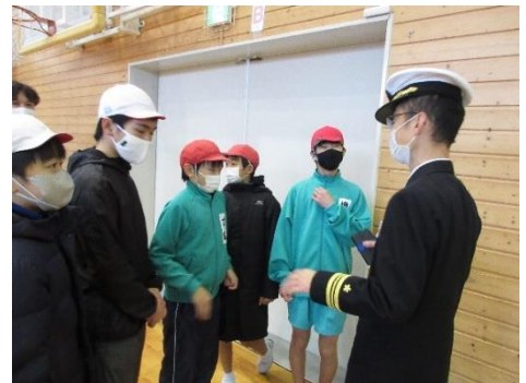
興味津々！授業後も質問していました