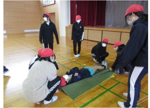
担架に乗る役、運ぶ役を体験しました