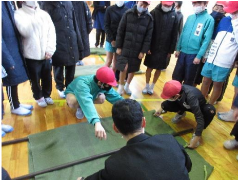
毛布と棒で応急担架を作りました