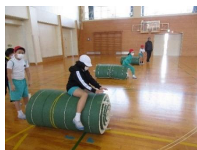
丸めたマットで跳び箱の練習