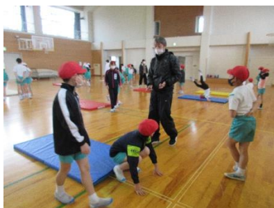
後転にチャレンジ！