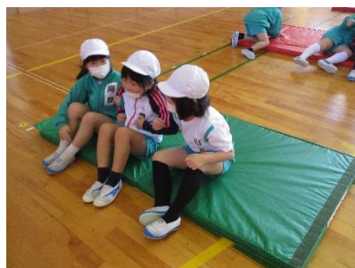
腕を組んで息を合わせて…