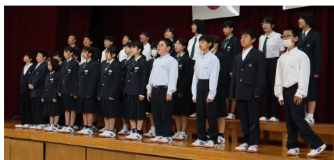
1組 自由曲「幾億光年」