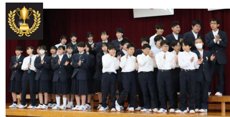
3組 自由曲「ただ君に晴れ」 【最優秀賞】

堂々と伝えたいことを表現する力がつきました。今まで何もかもはずかしがっていたけど、今回はクラスでたくさん練習して、自信をもって本番にのぞむことができました。