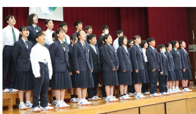
2組 自由曲「おかえり」