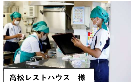
高松レストハウス 様