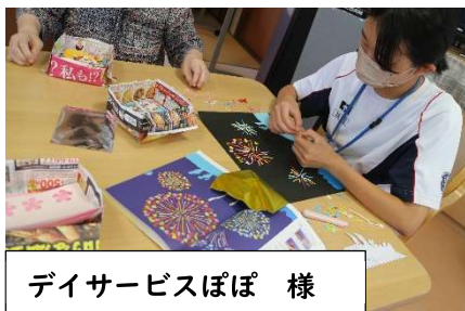
デイサービスぽぽ 様