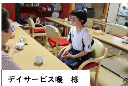
デイサービス暖 様