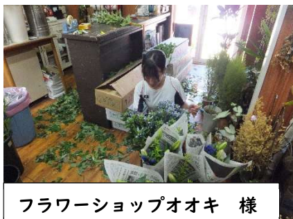
フラワーショップオオキ 様