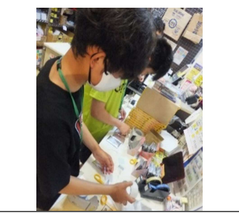
ヴィレッジヴァンガード 様