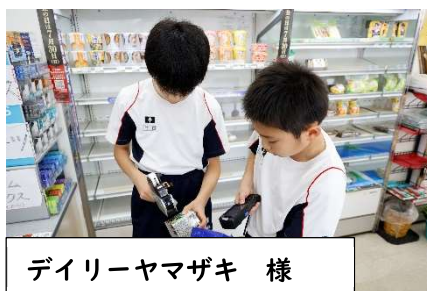
デリーヤマザキ 様