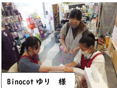
Binocot ゆり 様

かほく市内の31事業所のみなさまには、お忙しい中、事前打合せや受け入れの準備をしていただき、ありがとうございました。生徒は、実際の職場で就労体験することで新しい発見や気づきがあったことと思います。今回の職場体験を通じて、将来の自身の職業について考えるきっかけになることを願っています。