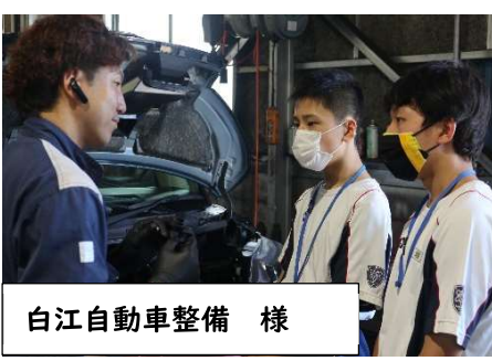
白江自動車整備 様