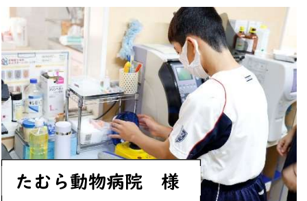
たむら動物病院 様