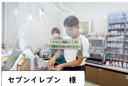
セブンイレブン 様