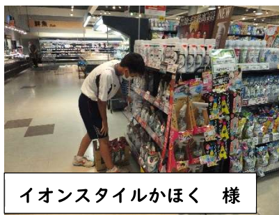
イオンスタイルかほく 様