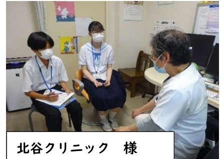
北谷クリニック 様