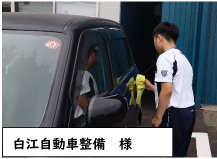
白江自動車整備 様