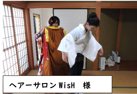
ヘアサロン Wish 様