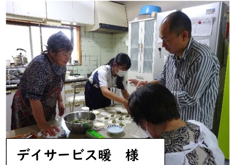
デイサービス暖 様