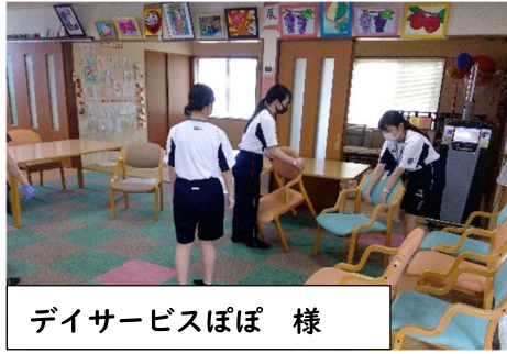
デイサービスぽぽ 様