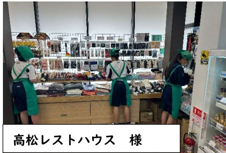
高松レストハウス 様