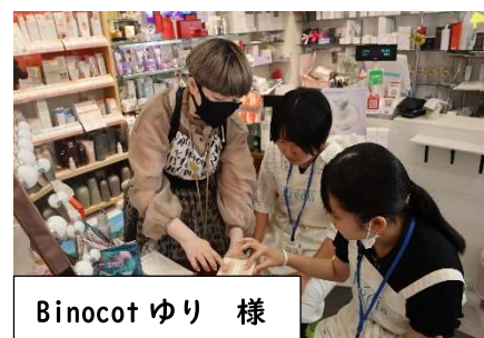
Binocot ゆり 様