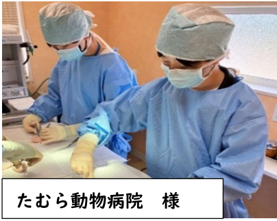
たむら動物病院 様