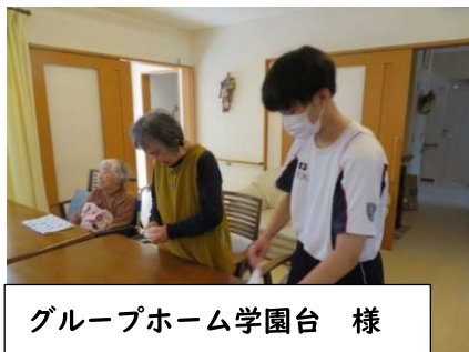
グループホーム学園台 様

今回の職場体験を通して、働くことの厳しさや喜びだけでなく、社会生活でのルールやマナーの大切さも実感できたのではないのでしょうか?自分の個性や特性を知り、将来の自身の職業について考えるきっかけになることを願っています。