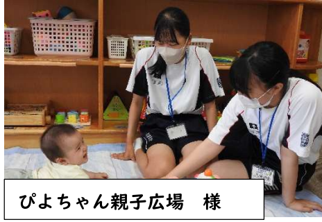
ぴよちゃん親子広場 様