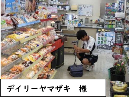
デイリーヤマザキ 様