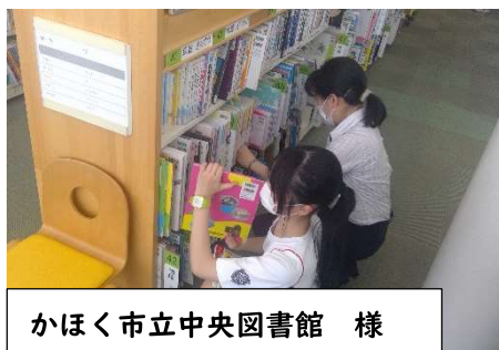
かほく市立中央図書館 様