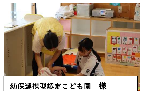
幼保連携型認定こども園 様