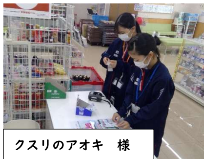
クスリのアオキ 様