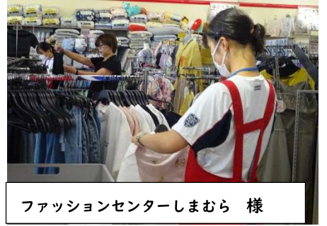
ファッションセンターしまむら 様