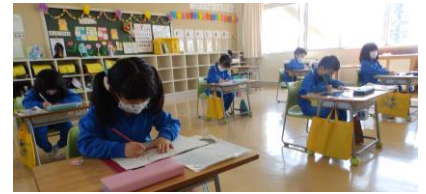
落ち着いて学習する1年生

「国語の本読みが楽しみです。」「体育の時間が楽しみです。」という声が聞かれました。中には、「掃除が楽しみです。」という子もいました。全校児童が、元気に、しっかりと学校生活を送っている様子を頼もしく思いつつ、この1年でよりよく成長させるために力を尽くそうと心に誓いました。