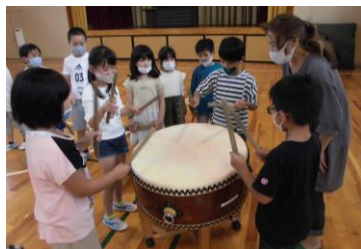
キリコ太鼓教室の様子（昨年度）

今年度の学校経営の重点の1つとして、「地域と連携した郷土愛を育む学校づくり」を挙げま