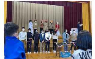
5・6年劇 「真夜中のサンタクロース」