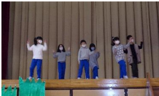
1年劇 「おむすびころりん」