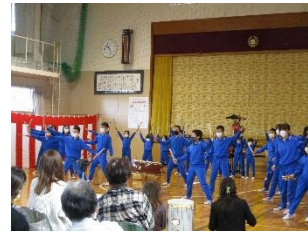
全校児童 「キリコ太鼓」