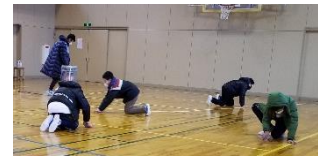
床を黙々と磨く6年生

「自分は成長している」という自覚は、意欲を高め、主体的に取り組む態度を育むことにつながります。修了・卒業まであと少しとなりましたが、子ども達の思いを大切にしながら、よりよく成長できるよう、今後も職員が働きかけていきます。ご家庭でも、お子さまとの会話の中で、親から見たお子さまの成長した点について伝えていただくよう、お願い致します。