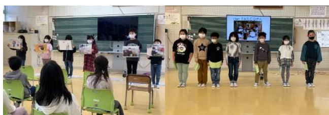
生活科・総合的な学習発表会