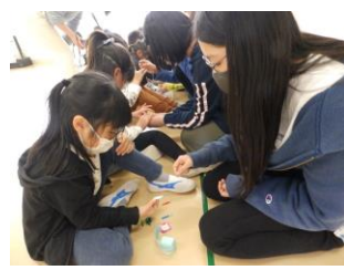
1年生と仲良く交流している様子