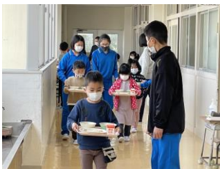
給食時、1年生を手伝っている様子

他の学年の児童も、1年生と遊ぶ会を行ったり、休み時間に遊んであげたりしていました。