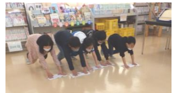
縦割り班で掃除をする様子

特に、意欲の高さを感じるのは5・6年生。「楽しい蛸島小学校にする」ために自分達ができることを考え、1年生が給食を運ぶのをサポートしたり、1年生とお楽しみ会を行ったりしました。お楽しみ会では、じゃんけんを取り入れた自己紹介や1年生が知っている‘だるまさんがころんだ’遊びを行い、折り紙で作った‘ミニランドセル’をプレゼントしました。1年生が喜んでいる姿をみて、5・6年生もうれしそうでした。