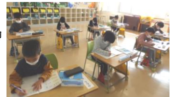
落ち着いて学習する1年生

1年生に学校生活についてインタビューすると、「お勉強が楽しみです。」「休み時間が楽しみです。」という声が聞かれました。中には、「掃除が楽しみです。」という子もいました。縦割り班での掃除の様子を見に行くと、上級生が率先して雑巾がけをし、1年生も一緒に取り組んでいる姿が見られました。「新しい学年でがんばるぞ」という意欲が感じられました。