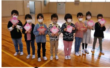
ハートの手作りペンダントをもらったよ!うれしいな♪

4月27日(水)に、1年生を迎える会が行われました。企画・進行は5・6年生で、学校のリーダーとして頼もしい姿を見せてくれました。1年生の自己紹介では、自分の夢や好きな食べ物を発表し、「だるまさんがころんだ」や「こおりおに」のゲームを全校児童+教職員で楽しみました。