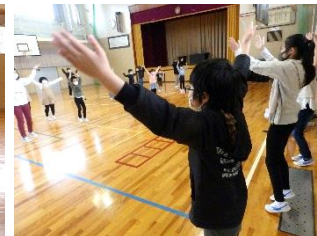
全体指導をする高学年児童