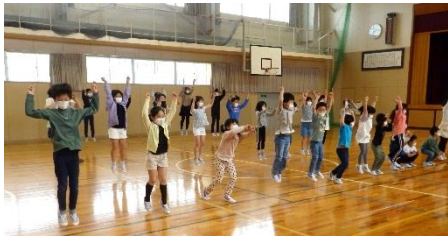
体育館での全校練習の様子

もう一つは、全校リズムダンス「Mela！」です。6年児童が選曲し、みんなのできる振り付けを考え、全校で練習してきました。リズムカルな曲に合わせ、下級生が5・6年生に教えてもらいながら、ダンスの練習を重ねてきました。休み時間に踊っている子が見られるほど、楽しい取組になっています。