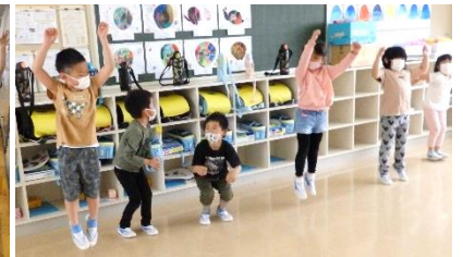
休み時間に楽しく踊る1年生