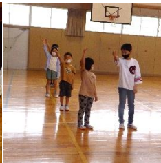
1年生に教える高学年児童