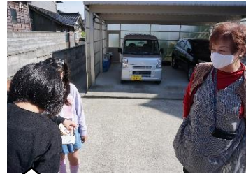
ツバメの巣はありますか?