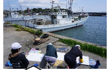
船や積んであるもの、海、空の様子もじっくり見て描くよ!

5月2日(月)に、蛸島漁港で写生大会が行われました。それぞれ、自分の描きたい船や風景を決め、じっくり見ながら描き進めていました。その後、学校で色塗りをし、作品を仕上げました。漁協の皆様、場所の使用等ご協力頂き、ありがとうございました。