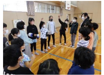
よりよく歌うために、班で話し合っている様子

その取組の一つが、「運動会の歌：ゴーゴーゴー」です。赤白の班ごとにそれぞれのパートを歌い、最後は同時に歌で競い合います。全体練習では高学年児童が下級生に‘歌や動き’を教える場があり、子ども同士の温かい関わりが見られます。運動会当日は、一人一人が元気な声で運動会を盛り上げてくれることでしょう。歌の取組は通年で行います。この取組で「思いを伝え合う」ために‘しっかり声を出す’ことができるよう指導しています。