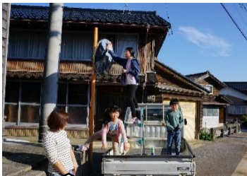
これで、車を運転する人も、私達も安心だね☆

5月7日(土)8日(日)に、PTA活動であるカーブミラー清掃が3年ぶりに行われました。さらに見やすいカーブミラーにするために、丁寧に拭いて汚れを取りました。子ども達が安全に登校・下校できる町づくりにつながる、有意義な活動となりました。PTAの皆様、ご苦労様でした。