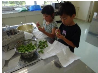
へたをきれいにとったよ!

1年生が生活の学習に、梅シロップ作りにチャレンジしました。学校の中庭などに実っている丸々とふくらんだ青梅をとって自分たちでへたをとり、氷砂糖といっしょに瓶に入れました。どんな味になるか楽しみです!