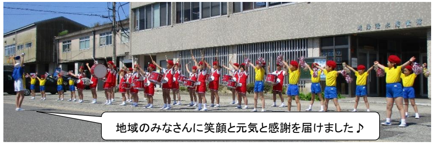
地域みなさんに笑顔と元気と感謝を届けました♪

6月4日(日)、創立記念行事(鼓笛演奏・運動会)が行われました。今年度は地震の被害での安全面を考慮し、固定演奏発表という形になりましたが、保護者や地域の方々に元気を届けようと、生き生きと演奏やダンスを発表することができました。温かい言葉や拍手など、ありがとうございました。運動会では、全力で走ったり、家族と笑顔で競技を行ったり、楽しくダンスを踊ったりして、充実した時間を過ごすことができました。PTA役員の皆様をはじめ、保護者の皆様、準備や後片付けのご協力、ありがとうございました。