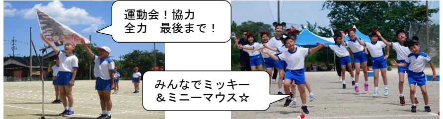
運動会! 協力 全力 最後まで!