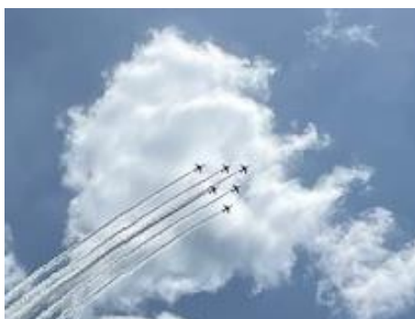
被災地上空を飛ぶブルーインパルス

今回の地震を通して、どんな状況でも、誰に対しても変わらない態度で接していらっしゃる信頼できる方々の存在に気づきました。人に良く思われようと、他人の意見に流されることがなく、正直な気持ちで、被災者のみなさんに接していらっしゃる姿から、人間として本当に大切なことが何であるかが、ストレートに伝わってきました。