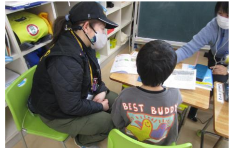
EARTHの皆様の継続的な支援

地震によって多くのものを失いましたが、逆に、失ったもの以上に「人と人のつながり」や「お互いに助け合う心」を得ることができたと思っています。今後の予測困難な時代を、自らの力で生き抜くため、子供たちにとっても、大きな教育的効果があったと考えています。