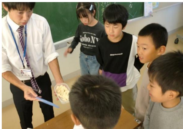
子どもたちの意欲を引き出す若手教員

新学期になり、授業中、元気に発表をする子どもたちと、それに笑顔で応える先生方の様子を見ていて、ある言葉を思い出しました。それが「啐啄同時（そったく どうじ）」という言葉です。今から十年以上も前の話になりますが、当時、私は県の出先機関に勤務していました。県内のある中学校を訪問する機会があり、案内された会議室の壁に「啐啄同時」と書かれた大きな額縁が掲げられていました。