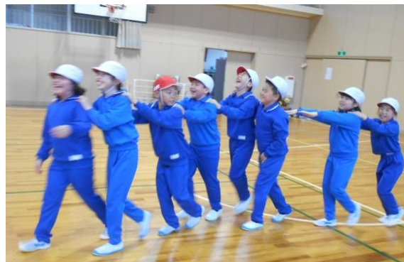
新学期を迎えた子どもたちの様子

新1年生を迎え、令和7年度の蛸島小学校も、明るく落ち着いた雰囲気です。子ども同士や、子どもと先生方が、交わす言葉や表情に温かみがあり、失敗や間違えも許され、何にでも挑戦できる雰囲気があります。これも、ご家庭や地域の中で、子どもたち一人一人が大切にされ、安心して毎日を送ることができているからだと思います。本当にありがとうございます。