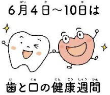
歯と口の健康週間

6/4～6/10は「歯と口の健康週間」です。食べ物を口に入れた後、あまりかまずに飲み込んでいませんか？よくかんで食べると、食べ物の味がよくわかっておいしく感じられるだけでなく、肥満予防やむし歯予防につながるなど、体にとっていいことがたくさんあります。丈夫で健康な歯と口を保つために、日頃からよくかんで食べる習慣をつけましょう。