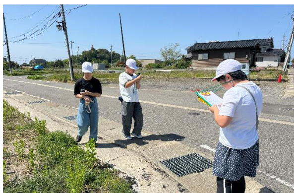
落ちていた「ゴミ」について調べる高学年児童

実際に会場に行き、子どもたちは、何を見て、どんなことを感じたのでしょうか。その場に行った人しか分からないことや、数年後まで残る記憶など、まさに「百聞は一見にしかず」全てが、心の財産となっていくと思います。