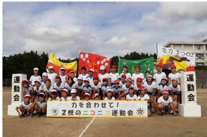
昨年の蛸島小と正院小の合同運動会の様子

何を隠そう、私は「雨男」なので、正院小の校長先生の「晴れ男」パワーをいただいて、「過ごしやすい曇り空」になればいいのですが・・・