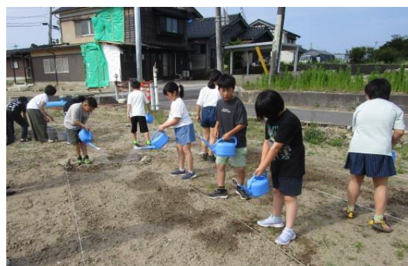
水やりに励む蛸島小の子どもたち

創立150周年記念式典が終わった数日後、5・6年生全員と担任の先生が、「校長先生にお願いしたいことがあります。」と校長室にやって来ました。