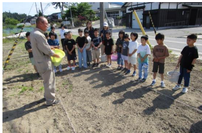
解体後の空き地にコスモスのタネまきをする子どもたち

このような「 ゼロリスク思考 」は、脳の防御作用の一つで、新しい挑戦をしようとする際、「失敗」や「損失」を想像し、前へ踏み出そうとする行動を妨げるそうです。どんな人でも、失敗や苦勞、責任を伴うことは、できる限り避けたい気持ちは、私も十分理解できます。