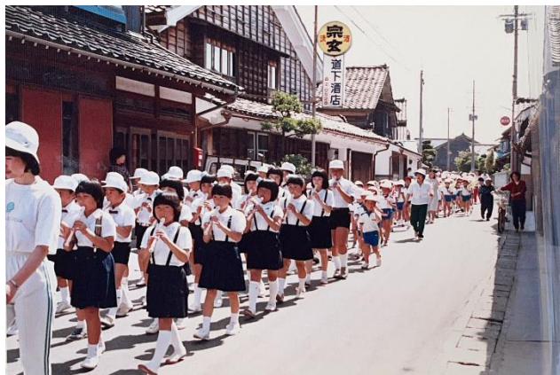
昭和59年の創立110周年記念パレードの様子

創立から数えて150年が過ぎました。一言で150年といっても、度重なる戦禍や、幾多の自然災害、政治経済の変動等、今の私たちには計り知れない時代の波を乗り越えて今日に至ります。