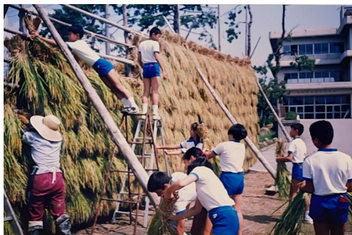
学校前で、「はざかけ」をする子どもたちの様子

記念式典を迎えるにあたり、校長室にある蛸島小に関する保存資料やスナップ写真、アルバム等を、じっくりと見てみました。様々な年代の写真を見ていて、共通していることに気がきました。