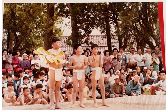
たくさんの方々の声援を受けてがんばる子どもたち

保護者の皆様、地域の皆様、6月1日（日）9時からの開式となります。写真展、150年のあゆみのスライドショー、子どもたちのアトラクションも合わせてご覧ください。お待ちしております。