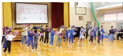
全校ダンス: オレンジ