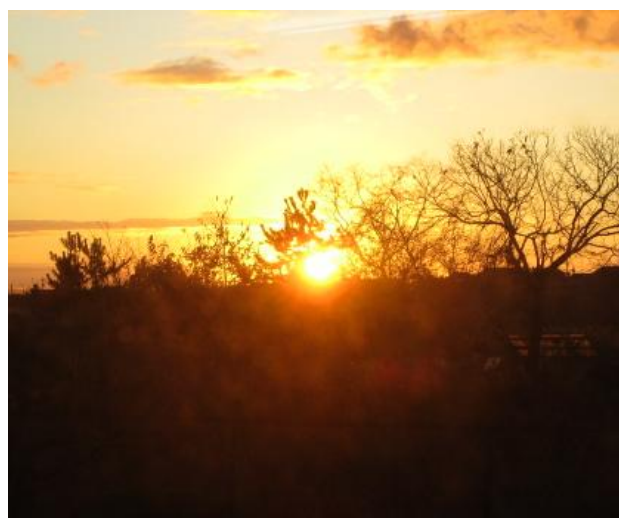
12月の朝、校長室の窓から見た日の出

朝、家を出て、蛸島小に向かって車で走っていると、思わず「わあ、きれいだな。」と口に出して言うくらい、美しい日の出を見ることが度々あります。日の出と、日の入りと両方とも、陽の光は赤色に輝いて見えますが、個人的には、同じ赤色の陽の光でも、朝日の方に、よりエネルギーを感じます。つい先日は、道端で、両手を合わせて、日の出を拝んでいらっしゃる年輩の方を見ました。