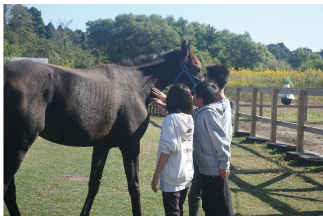
震災前、ホースパークで馬と触れ合う蛸島小の子どもたち

に、新しいことにチャレンジするのもいいかも知れません。昔は、丙午(ひのえうま)に生まれた女の子は、気性が激しく周りの人が苦勞する」という迷信がありましたが、多様化や、ジェンダーフリーが進んだ今は、干支の一つとしての捉えになっているように感じます。