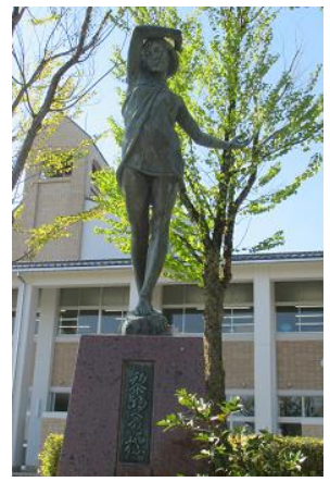
黎明への標(しるべ)