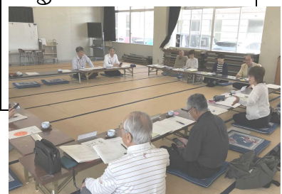
【第1回学校運営協議会】