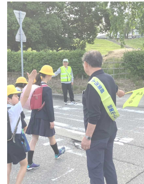
【協議会委員による挨拶活動】

これらを受けて意見交流がおこなわれ、4校の交流と9年間を見据えた連携の大切さを確認し、今後の連携を強化することで一致しました。