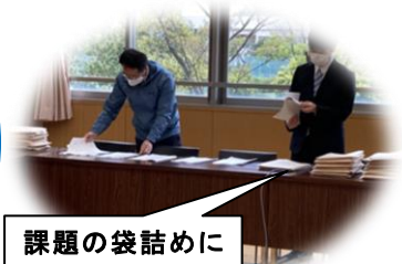
課題の袋詰めに奮闘しています

☆私は、課題も順調に進み、運動も欠かさず行って、不便なことも多いですが、毎日元気に過ごしています。最近は母と手作りマスクを作ったのが楽しかったです。