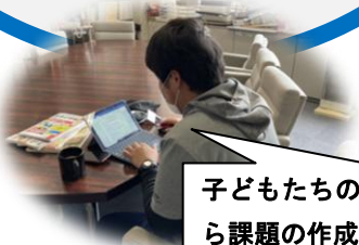
子どもたちの顔を思い浮かべながら課題の作成に取り組んでいます