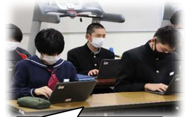
発表の感想を入力