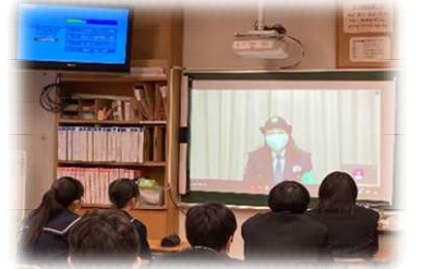
全校集会での回収結果報告

12月17日(金)に能美警察署の方に来ていただき、「SNSの危険性、スマホの使い方について」と題してお話をいただきました。身近な事例を取り上げ具体的にわかりやすくお話をいただきました。また、警察制作の動画「TAPS～その指先が導く危険～」も視聴しました。この講座の内容については、保護者向けに配信させていただきました。ぜひ、ご家庭でSNSの危険性について話す機会をつくっていただければと思います。