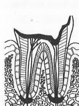
第4段階 歯根だけになってしまったむし歯

神経が死んで痛み はなくなりますが、 細菌が歯根から体 中に散らばり、病 気になる危険があ ります。