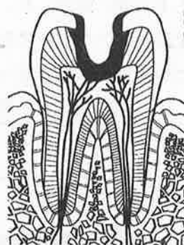
第3段階 歯髄まで達したむし歯