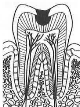
第2段階 象牙質のむし歯