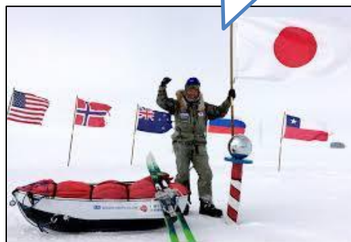
(インターネットフリー写真)