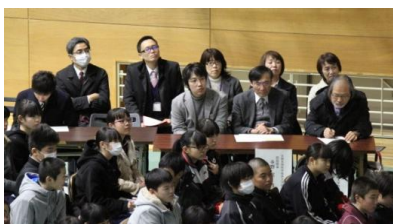
<お世話になった皆さん(来賓)>

また、今回の学習を進める中で、能美市のことをこれまで以上に知ることができたと思いますし、能美市が好きだという思い、ふるさとへの愛着が大きくなったのではないかと思います。ふるさとについて学ぶことは、「の」伸びゆく能美市を支える生徒への第一歩。町の先生、地域の方々やJAISTの先生方に大変お世話になりましたが、その方たちのふるさとへの思い、皆さんへの気持ちは、「伸びゆく能美市を支える」思いです。今、支えていただいていることに感謝し、やがてお返しできる人に成長してほしいと思います。