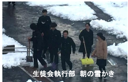
生徒会執行部 朝の雪かき

めざす学校・生徒像 た 楽しい学校 つ つながり合い高め合う生徒 の 伸びゆく能美市を支える生徒 く くじげずやり抜く生徒 ち 力いっぱい取り組む生徒