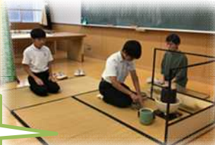
10日(金) 茶華道部 お茶会