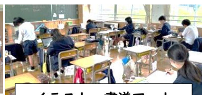
イラスト・書道アート