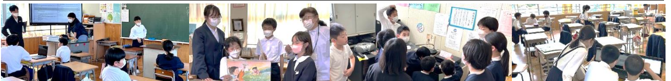
運動が好きな人でいっぱいになるには、どうすれば？考え中です。(体育)