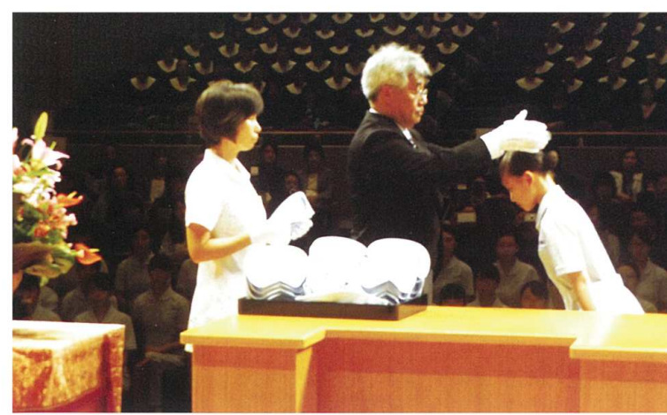
衛生看護科(戴帽式)

田鶴浜高校のカリキュラムは、社会人としての幅広い教養を身につける共通教科はもちろん、将来、看護職、福祉関連職を目指す生徒のために、専門教育に重きを置き、実習など実践的な授業が多彩に盛り込まれています。また、大学・短大・専門学校への進学指導や、資格試験対策などもきめこまかにおこなっています。