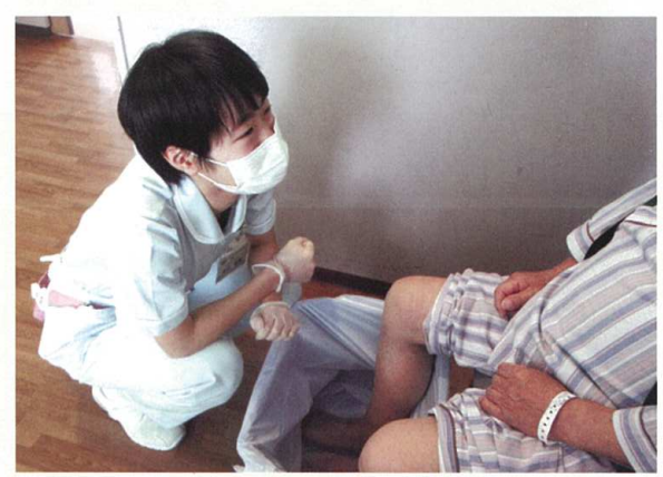
臨床実習(衛生看護科)