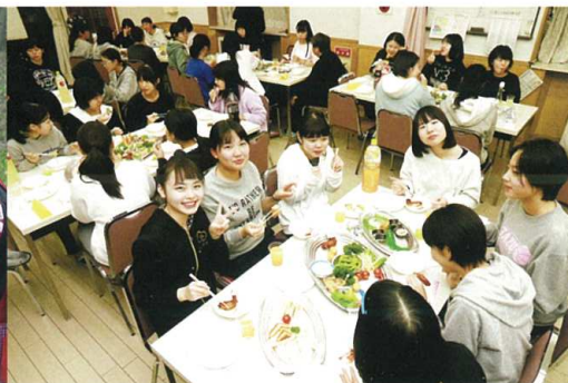
クリスマス会(鶴明寮)