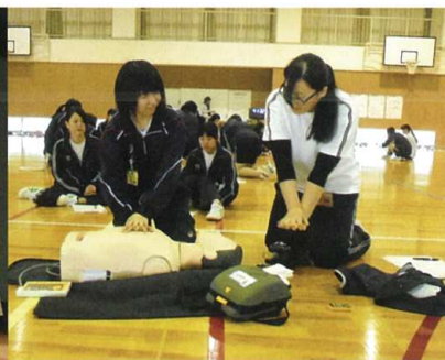
5学年合同研修(衛生看護科)