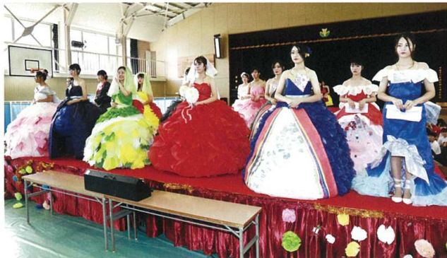
文化祭(ペーパードレスショー)