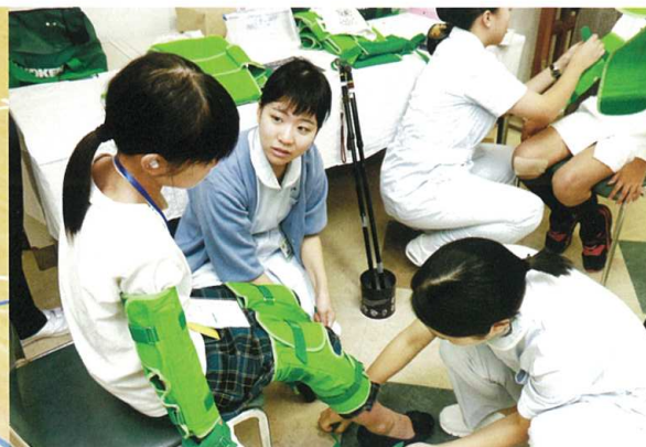
いしかわ産業教育フェア