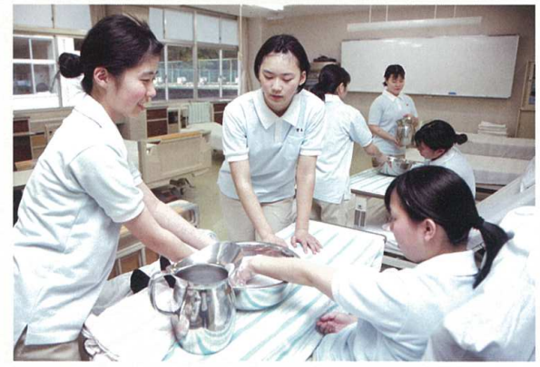
校内実習(健康福祉科)