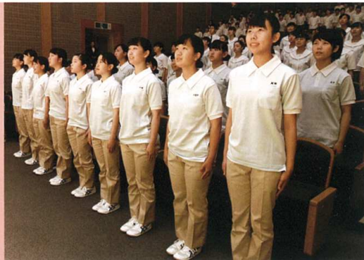
福志式(健康福祉科)