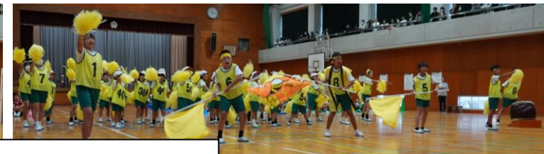
各団、心ひとつに闘志を燃やした熱い応援！