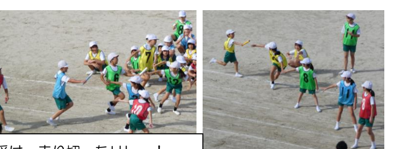
みんなの熱い声援を一心に受け、走り切ったりレー!