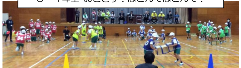
3・4年生 おとさず! はこんではこんで!