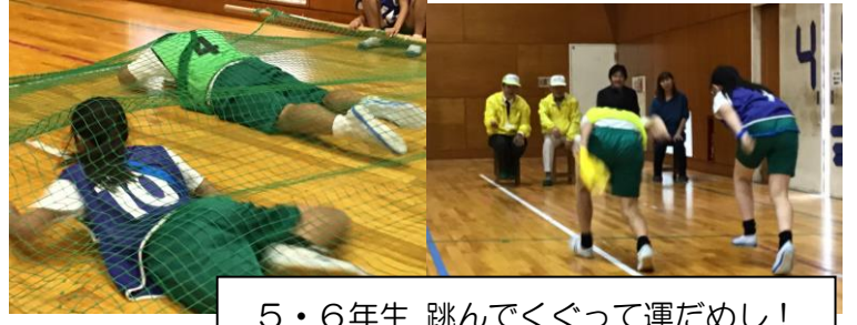
5・6年生 跳んでくぐって運だめし!