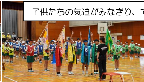
子供たちの気迫がみなぎり、てんじんピック開幕！