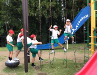
1・2年生！かほく方面