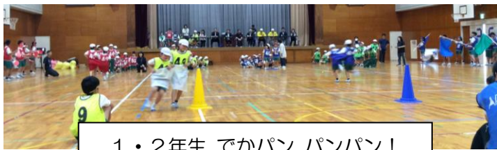
1・2年生 でかパン パンパン!