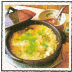
やながわ 柳川なべ

とうきょう きょうと あじ えどじだい えいきょう いろこ のこ 東京の郷土の味には、江戸時代の影響が色濃く残っています。 また、こうがい ゆた しぜん なか はく やさい いす おがさわらしょう また、郊外では豊かな自然の中で育まれる野菜や、伊豆・小笠原諸島な どのしまじま かいさんぶつ とくさんひん どの島々にも、海産物などのたくさんの特産品があります。