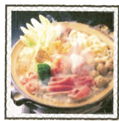
ちゃんこなべ など