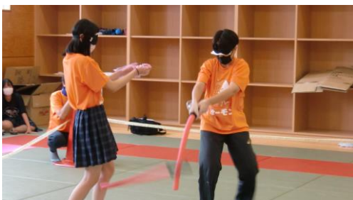
盛り上がった12H企画「気配切り」 (初日：文化祭)