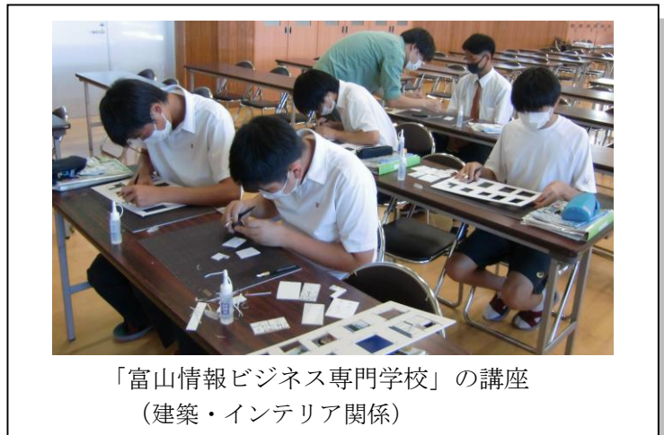
「富山情報ビジネス専門学校」の講座 (建築・インテリア関係)