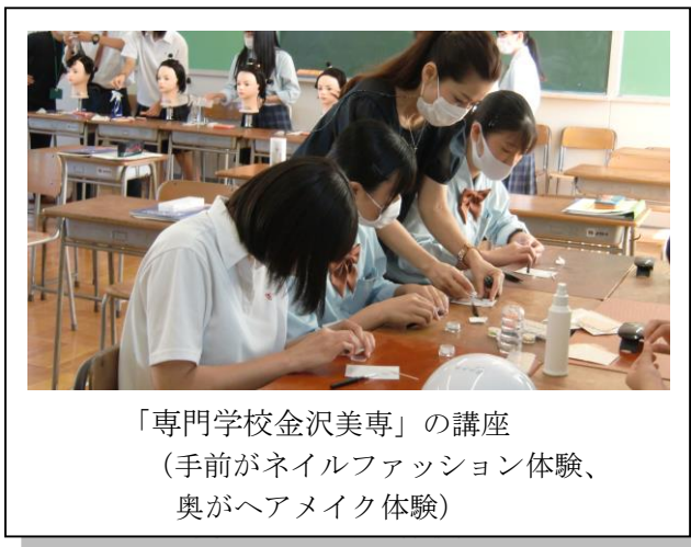
「専門学校金沢美専」の講座 (手前がネイルファッション体験、 奥がヘアメイク体験)