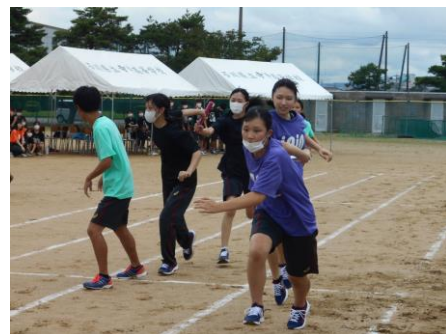
クラス対抗リレー(2日目：体育祭)