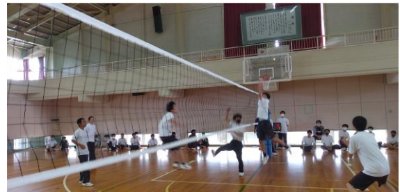
6月8日（水）球技大会の様子 ※左：女子ドッジボール 右：男子バレーボール