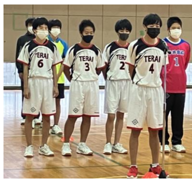
ハンドボール部 ソフトテニス部