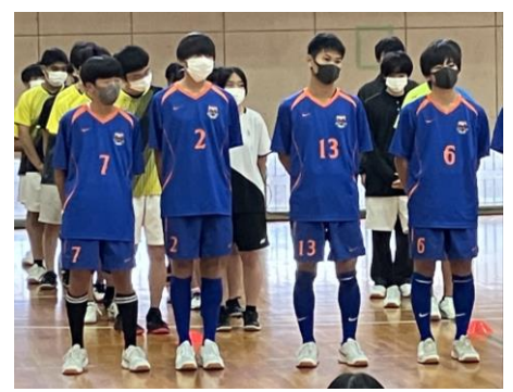
サッカー部 バスケットボール部