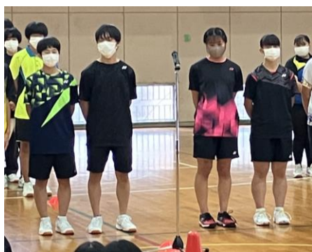
バドミントン部 放送部

ほとんどのインドア競技と文化部にとっては、3年生引退後の初めての大きな大会となりました。どの部活動も人数は少なめですが、十分に力を発揮してくれました。