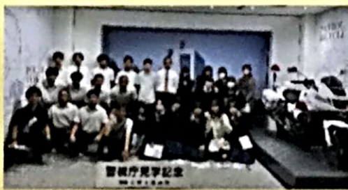
修学旅行見学記念