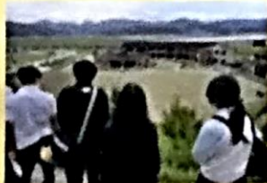
震災遺構 大川小学校

宮城・震災学習、世界遺産の平泉中尊寺見学を行い、横浜自主プラン、東京ディズニーランドを満喫し、特色ある系列別の研修もありました。