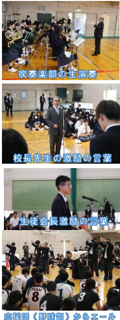
応援団(野球部)からエール