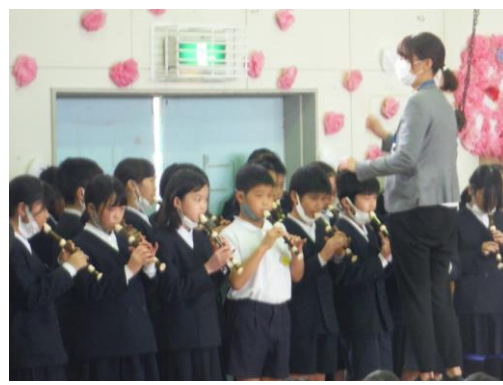
5年生入退場の合奏