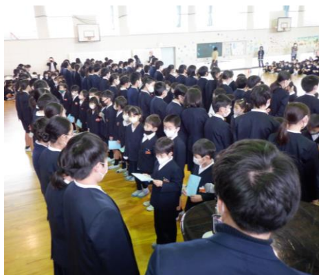
1年生プレゼント渡し