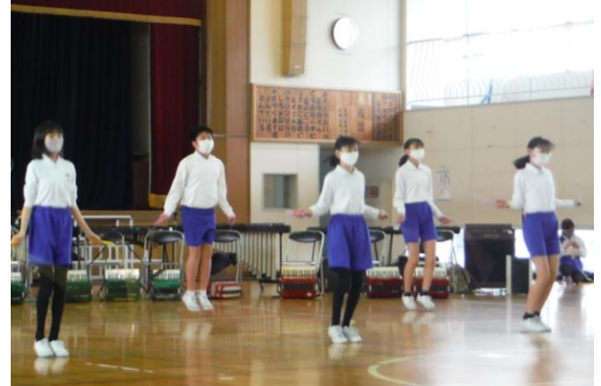
卒業発表会体育発表より