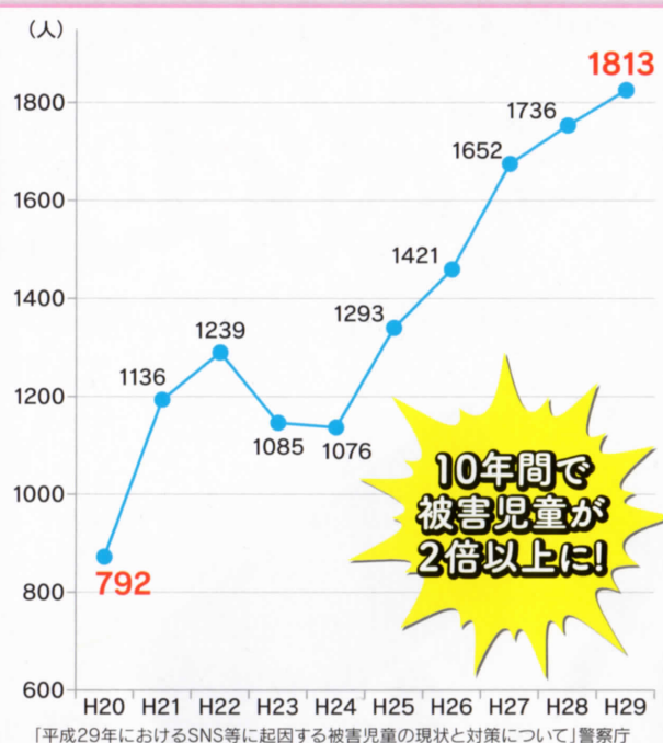
SNS等に起因する事犯の被害児童数の推移

危険性を 知る 知らないうちに犯罪に巻き込まれたり軽い気持ちで始めたことで加害者になったりすることも