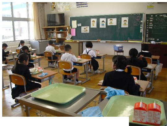
↑1年生の「はじめての給食」

4月11日から、1年生も給食がはじまりました。鳥越小学校にはランチルームがありますが、間隔をとって食事をするために、1・2年生は教室で給食を食べています。