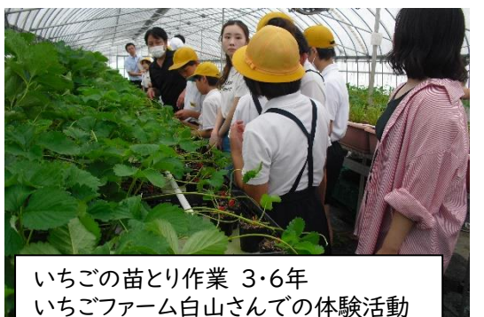
いちごの苗とり作業 3・6年 いちごファーム白山さんでの体験活動