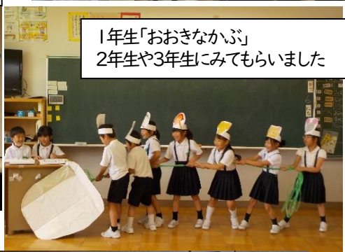
1年生「おおきなかぶ」 2年生や3年生にみてもらいました