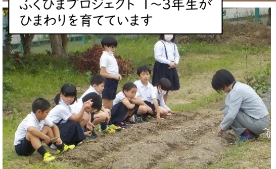
ふくひまプロジェクト 1～3年生が ひまわりを育てています