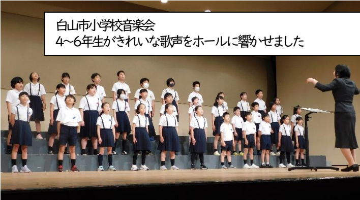
白山市小学校音楽会 4～6年生がきれいな歌声をホールに響かせました