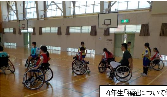
4年生「福祉について学ぶ」 車いすも盲導犬も、自分らしく生きるためのパートナー