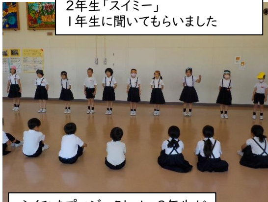
2年生「スイミー」 1年生に聞いてもらいました