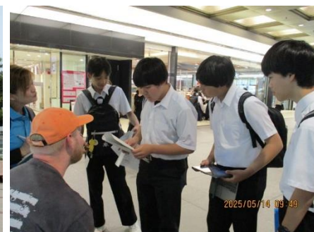
英語でインタビュー