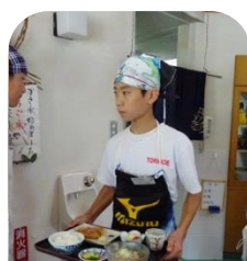
河内地場 産業センター