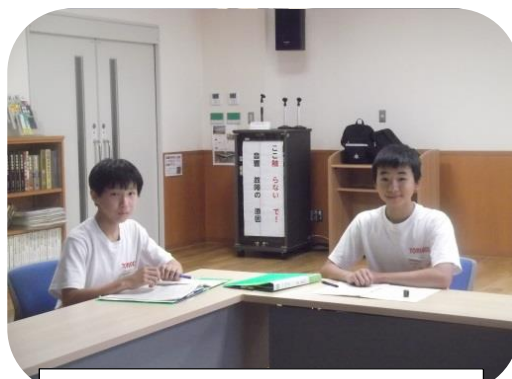
鳥越市民サービスセンター