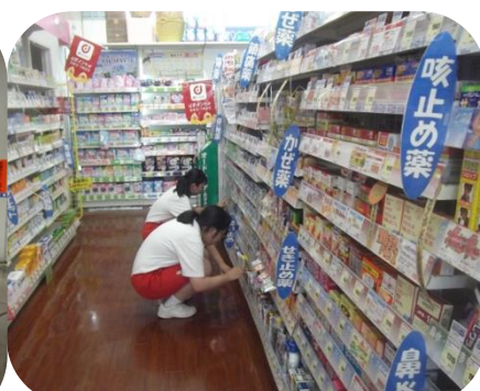
コメヤ薬局かわち店