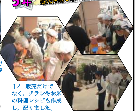
↑販売だけでなく、チラシやお米の料理レシピも作成し、配りました。