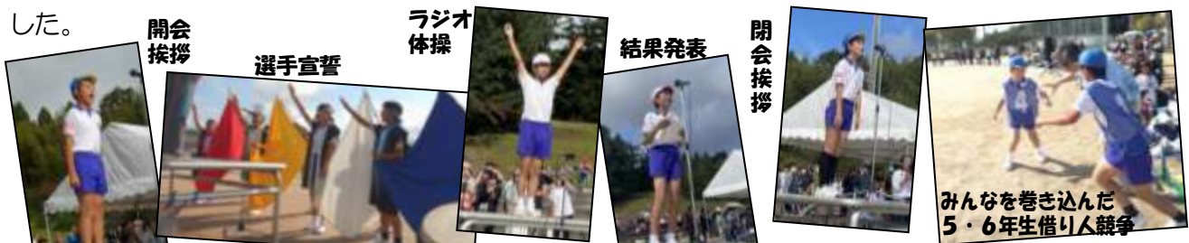
みんなを巻き込んだ5・6年生借り人競争

平日で、しかも延期となり、保護者の皆さんにはご心配やご迷惑をおかけしました。しかし、本当に笑顔・感動・成長のある運動会を行うことができました。いつも子どもたちを応援し、そして学校にご協力くださる保護者の皆さん、地域の皆さんに心から感謝致します。ありがとうございました。