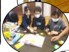
←皆さんに喜んでもらえるような内容を考えました。