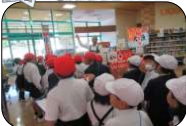
↑お店としての注意点や工夫等を学び、買い物体験もしました。