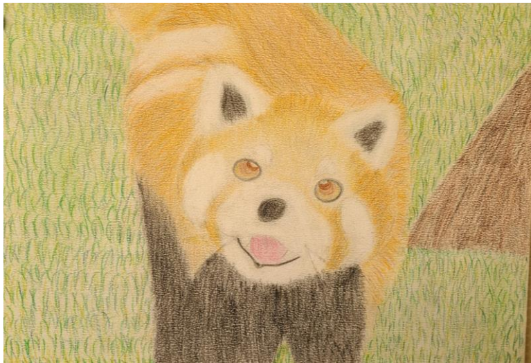
← 2組 西村 優杏 さんの作品