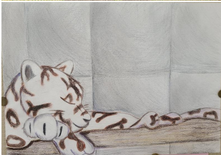
← 5組 細金 俐央 さんの作品